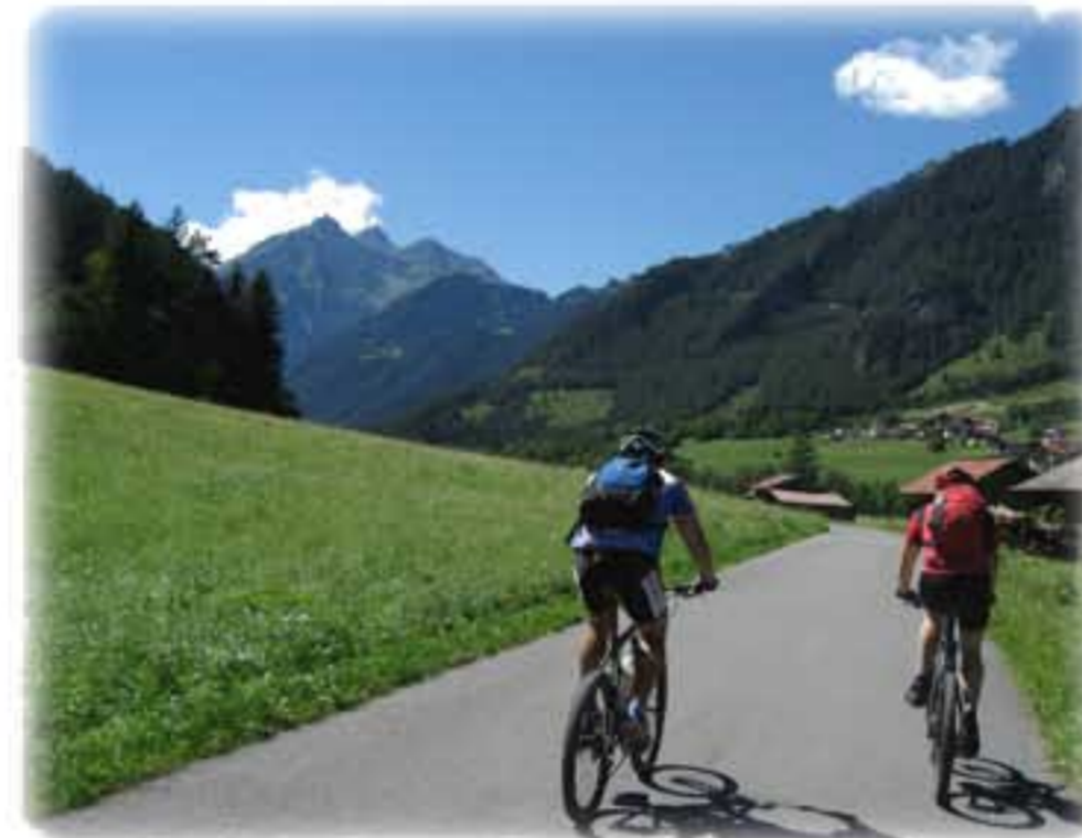
Entspannt am Inn entlang