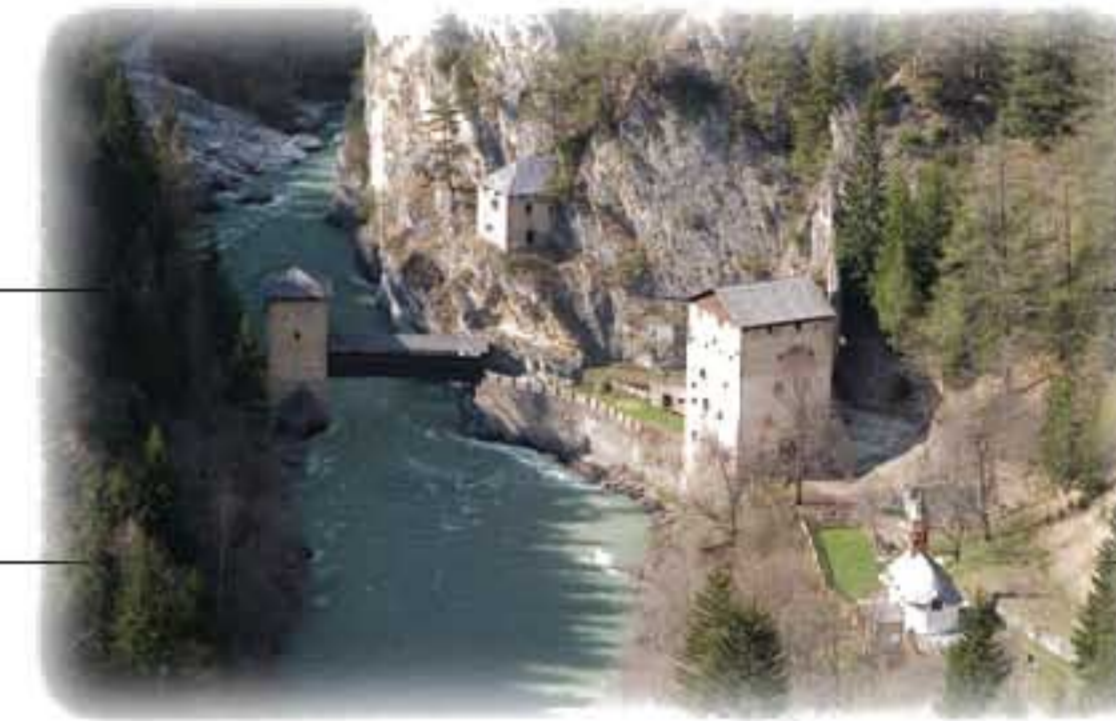
Altfinstermünz - Gerichtsstätte 9.Jhd.