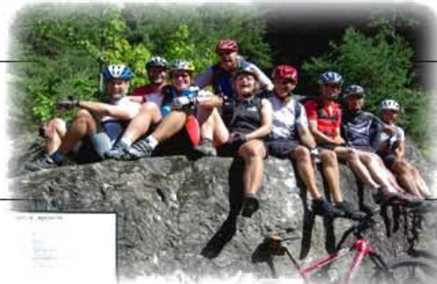
Flieser Platte mit schönen Trails!